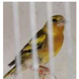
Ibrido di VERDONE x FRINGUELLO