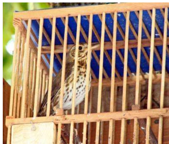
Tordo bottaccio ( Turdus philomelos ).