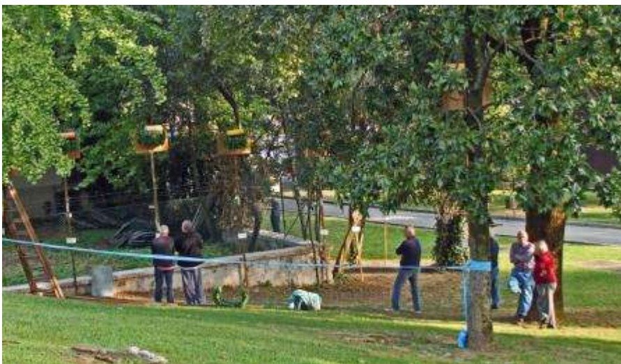
Merli in gara

La gara canora prende il via in una fantastica mattinata soleggiata.