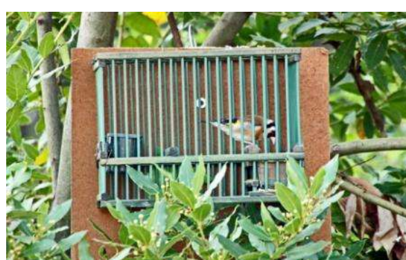
Cardellino ( Carduelis carduelis ).