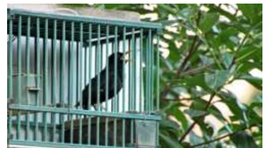
Merlo (Turdus merula).