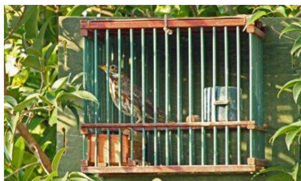
Tordo sassello ( Turdus iliacus ).