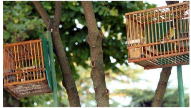
Lucherini (Carduelis spinus).

Non poteva mancare il settore delle QUAGLIE .