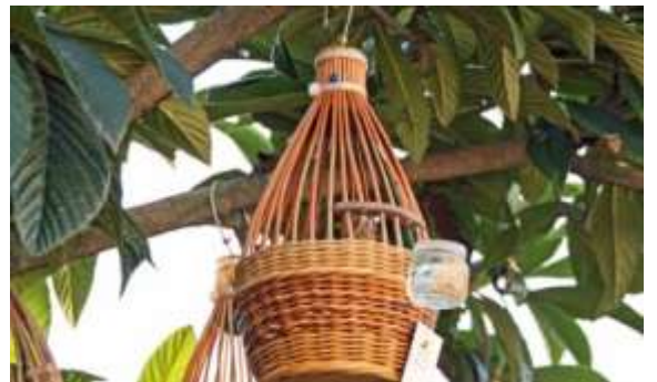
Quaglia (Coturnix coturnix).

La “via” degli uccelli da gabbia – voliera e gli animali da cortile .