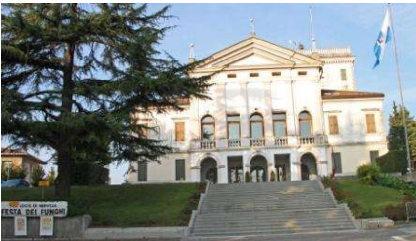
Villa Volpato Panigai, sede del Municipio.

lato nord/est del comune. Nervesa si estende per circa 35 Kmq e offre al visitatore un territorio vario. In pochi chilometri si passa dalla pianura, al saliscendi del Montello con le sue doline al fiume Piave ricco di storia. Il fiume Piave , ricco di storia, costeggia il lato nord/est del comune. Fin dal Neolitico era frequentato da cacciatori che trovavano facili prede: e lo testimoniano i numerosi reperti trovati. Durante il periodo della Serenissima le sue acque erano usate per il trasporto del legname che dal Bellunese e dal Montello scendeva fino ai suoi cantieri. (vedi la storia dei "zattereri"). Qua si svolse la "battaglia del Solstizio", così chiamata dal D'Annunzio, tra il 15 e il 23 giugno 1918 (Prima guerra mondiale), l'ultima grande offensiva sferrata